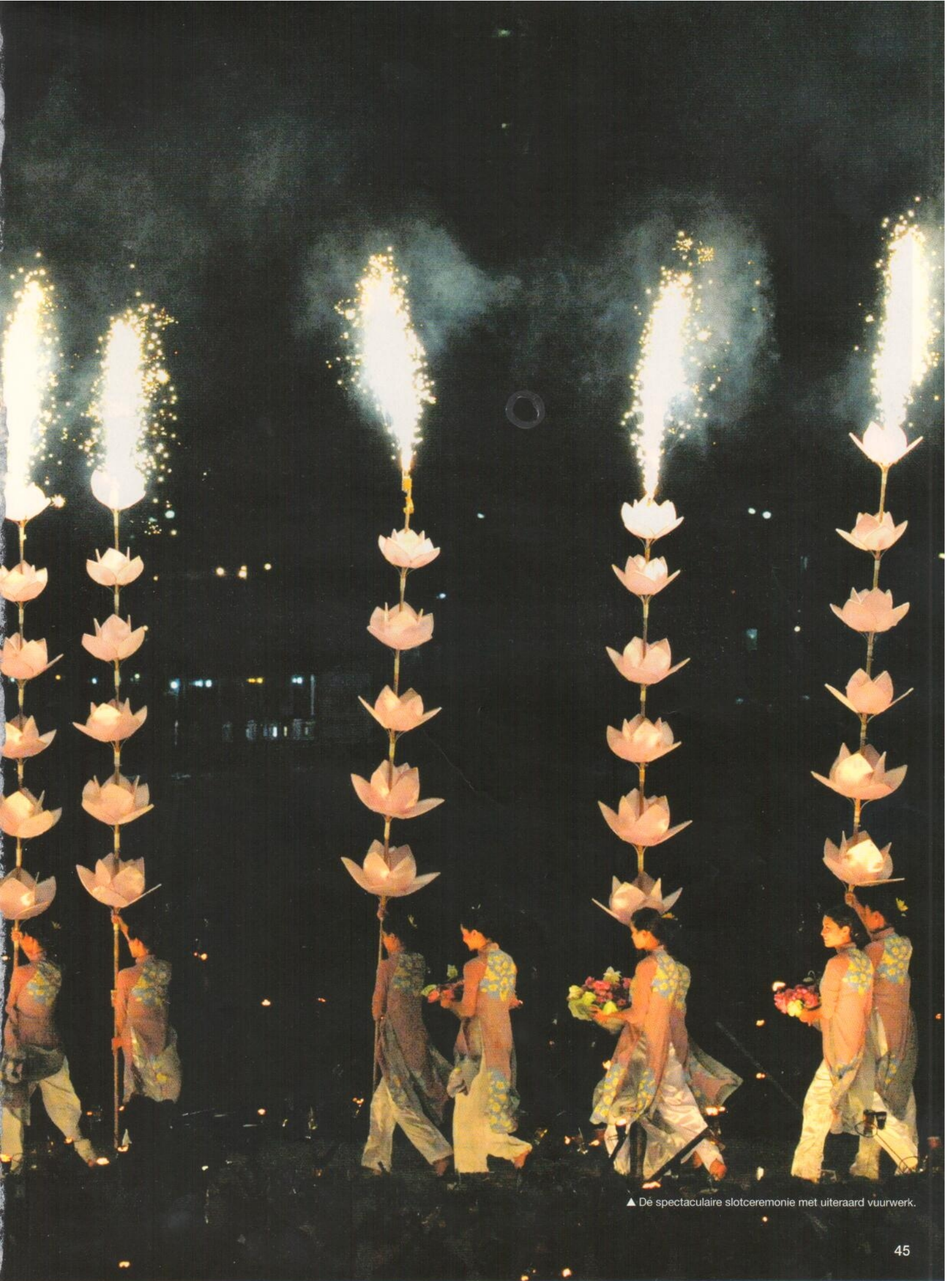
▲ Dé spectaculaire slotceremonie met uiteraard vuurwerk.